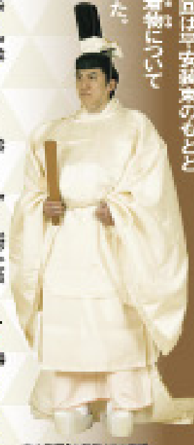
京中皇居「大嘗会」での皇居 大嘗会御奉告 (YASUO SAZUICHI SATO) 今年も、10月22日、1250年経ち、 皇居平安京遷都の日、即位の日にあつた。

新天皇陛下の御即位をお祝いする「即位礼正殿の儀」が今年限定の「国はの祝日」となり、10月22日に行われます。即位の日は平安京遷都十二周年で、ほかの成人皇族方も平安京遷都でお出ましになります。皇居・宮殿で平安祭奉告のまじに賑り広げられ、国民「ごとく祝賀を示す日」となります。 そして、今回は平安京遷都の「まじ」になった衣服、着物について調べてみました。